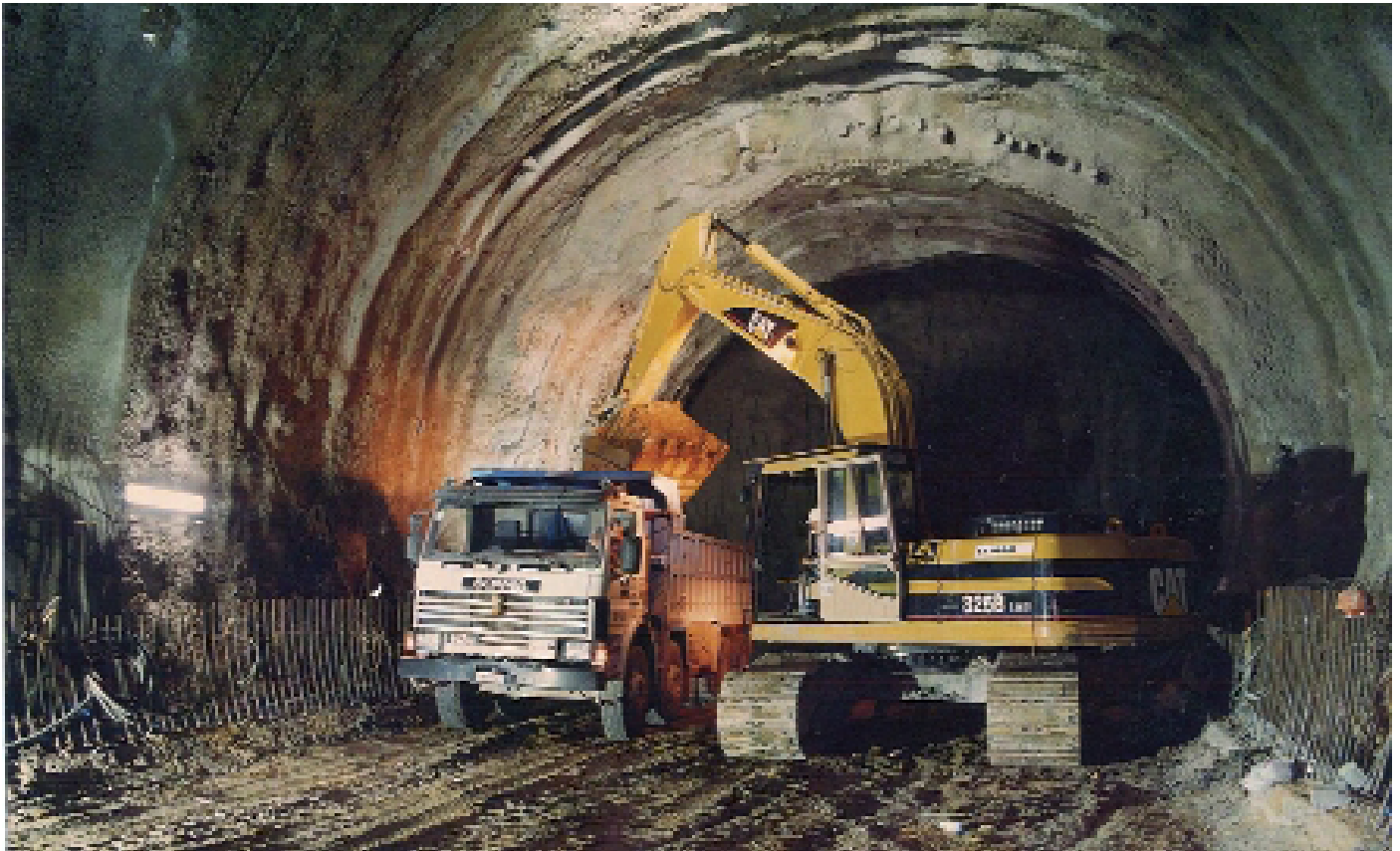
Σήραγγα Γηροκομείου Ευθείας Παράκμης Πατρών