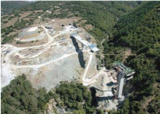
Εγνατία Οδός - Σήραγγα Ανθοχωρίου