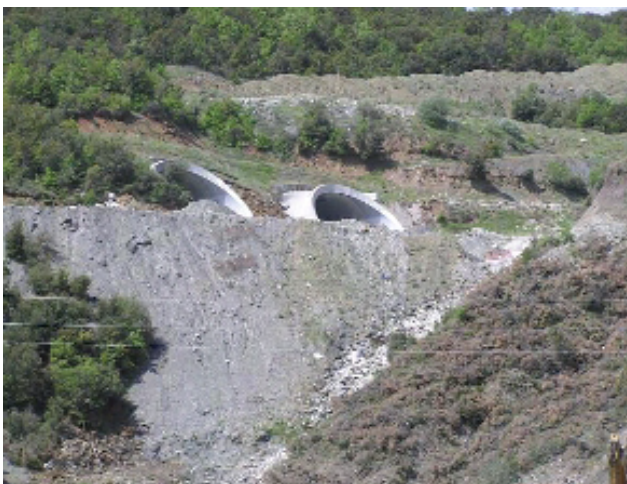
Εγνατία Οδός - Σήραγγα Τ6 στο Τμήμα Αραχθος - Περιστέρι