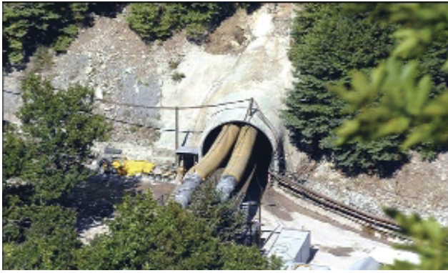
Σήραγγα Εκτροπής Αχελώου