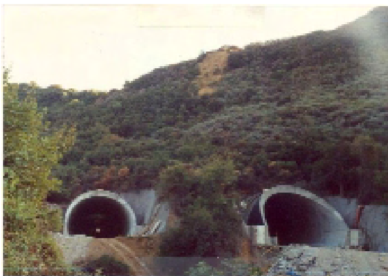
ΑΕΓΕΚ Α.Ε. - Σήραγγες Γηροκομείου & Αρχαιολογικού χώρου της Ευρείας Παράκμης Πατρών