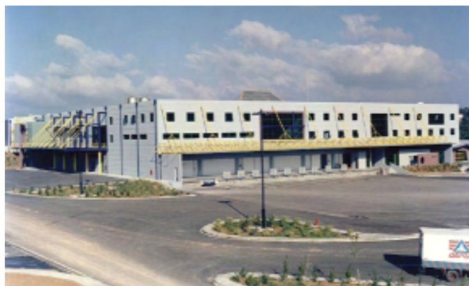
ΔΕΛΤΑ Α.Ε. - Εργοστάσιο Γιαουρτιών Δέλτα