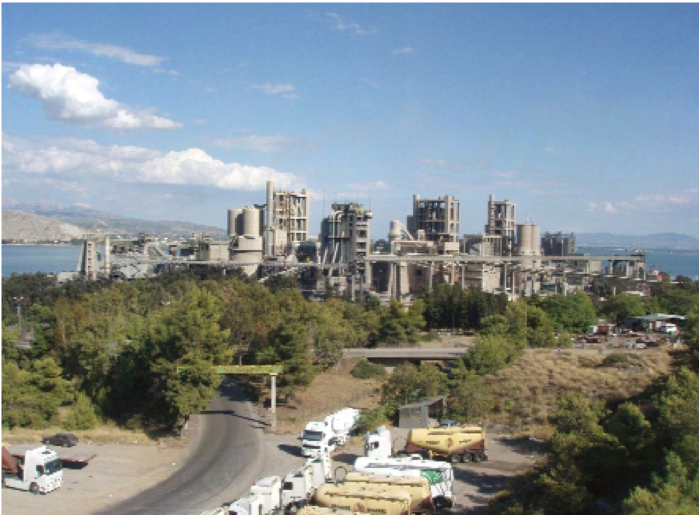
ΑΓΕΤ Μηλάκι, Ευβοια