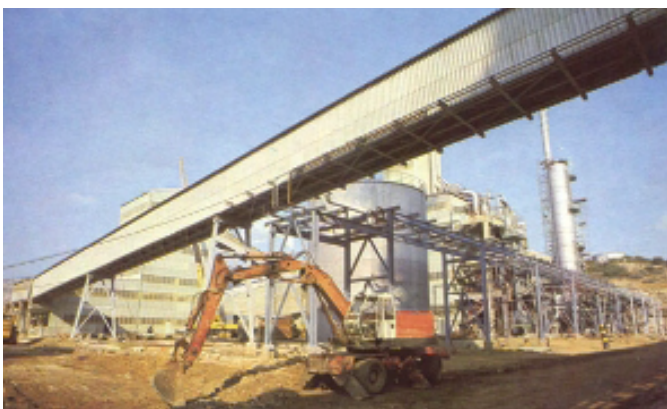
Βιομηχανία Φωσφορικών Λιπασμάτων - (Β.Φ.Λ.)