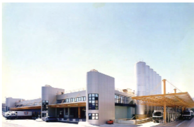
ΔΕΛΤΑ Α.Ε. - Εργοστάσιο Γάλακτος Δέλτα