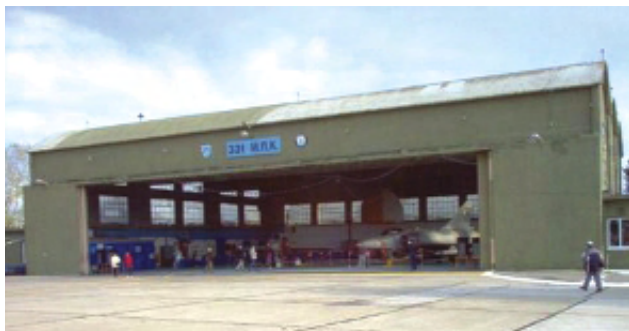
Υπόστεγο Αεροσκαφών στη Τανάγρα