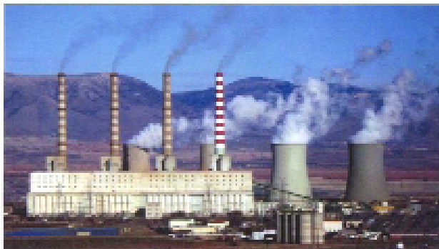
ΜΕΤΚΑ Α.Ε. / ΔΕΗ - Ηλεκτροστατικά φίλτρα ΑΗΣ Καρδιά